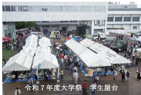
令和7年度大学祭 学生屋台