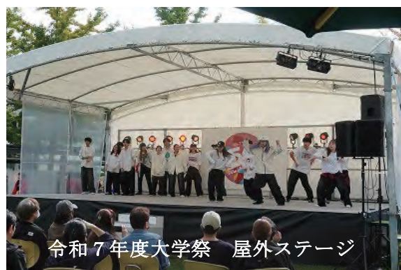
令和7年度大学祭 屋外ステージ

東北工業大学への社会の期待は高まる中で、学生への援助ができますよう、今後ともご協力をいただきたくお願いいたします。