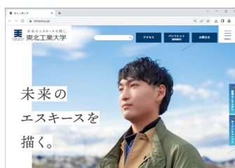
新しいスローガン「未来のエスキースを描く。」 (大学 Web サイト)