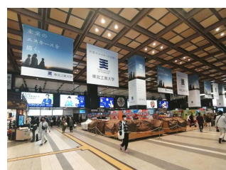
JR仙台駅へ大型フラッグ等を掲出 4月5日（水）～5月5日（金）